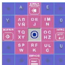
Figura 2. Ejemplo de una configuración aleatoria del teclado

En todo momento del proceso, el usuario debe tener acceso a distintos datos del estado del sistema; Por ejemplo: el conjunto de palabras ya seleccionadas, la “tecla” seleccionada, las palabras que se ofertan, etcétera