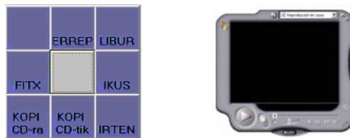
Figura 3. Esquema de interfaz del programa

Una idea de cómo quedaría nuestra aplicación sería la siguiente: